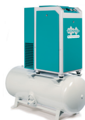
RSD-TOP 3,0 - 7,5 kW

RENNER Schraubenkompressoren mit Kältetrockner