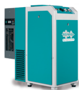
RSK-TOP 3,0 - 7,5 kW

RENNER Schraubenkompressoren mit Kältetrockner