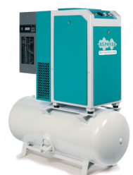
RSDK-TOP 3,0 - 7,5 kW

RENNER Schraubenkompressoren mit Druckluftbehälter