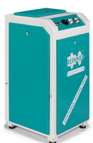
RS-TOP 3,0 - 7,5 kW

Noch kleiner. Noch leiser. Noch wartungsfreundlicher.